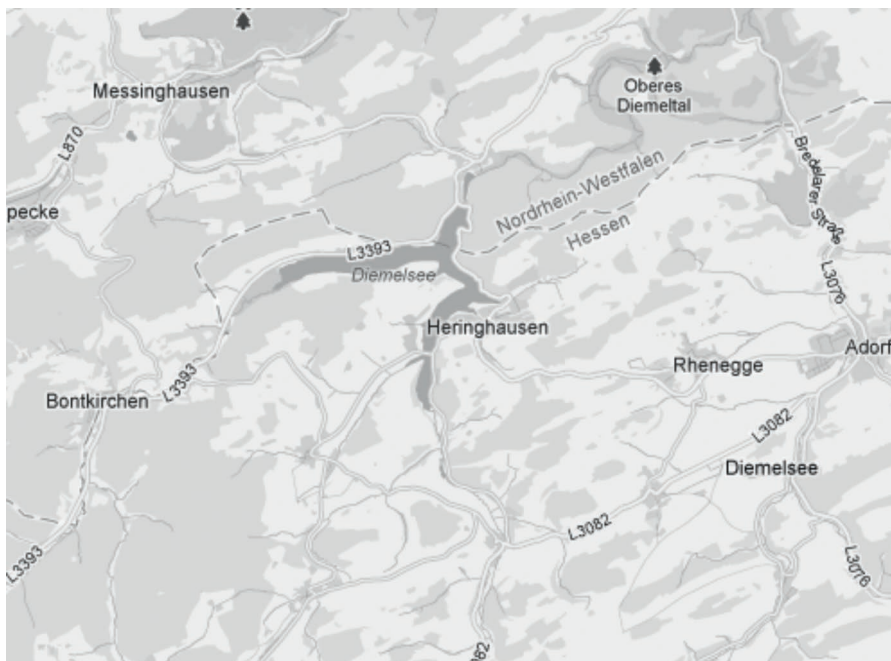
M 4: Freizeitkarte für den Diemelsee