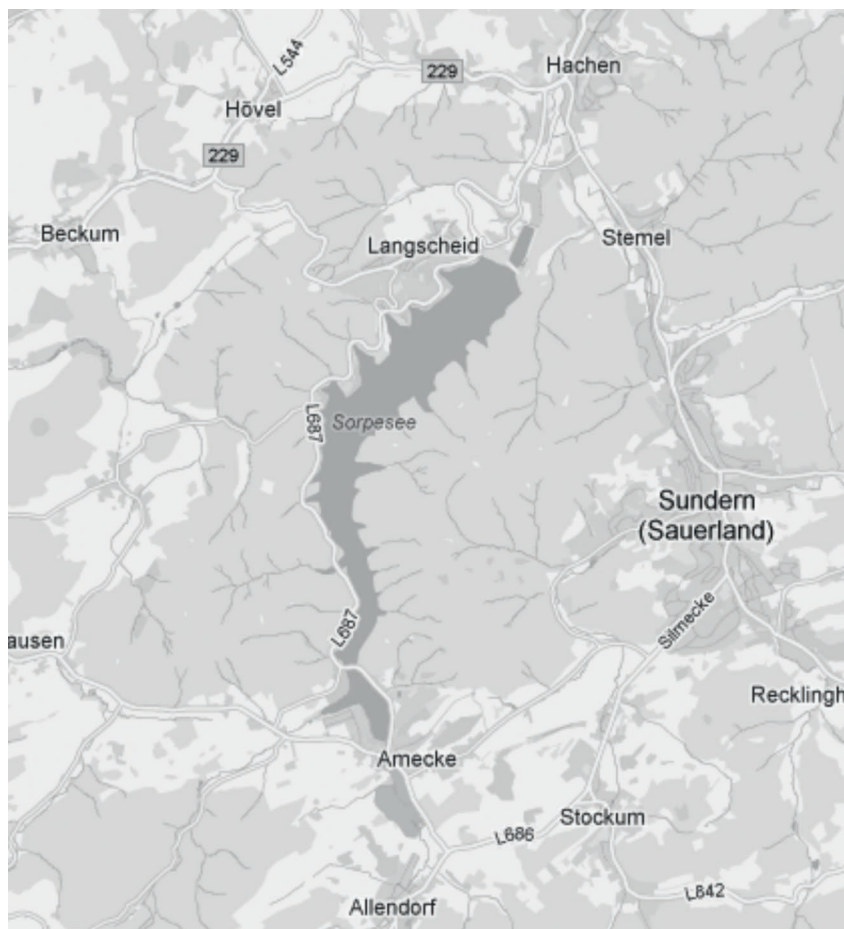
M 2: Freizeitkarte für den Sorpesee