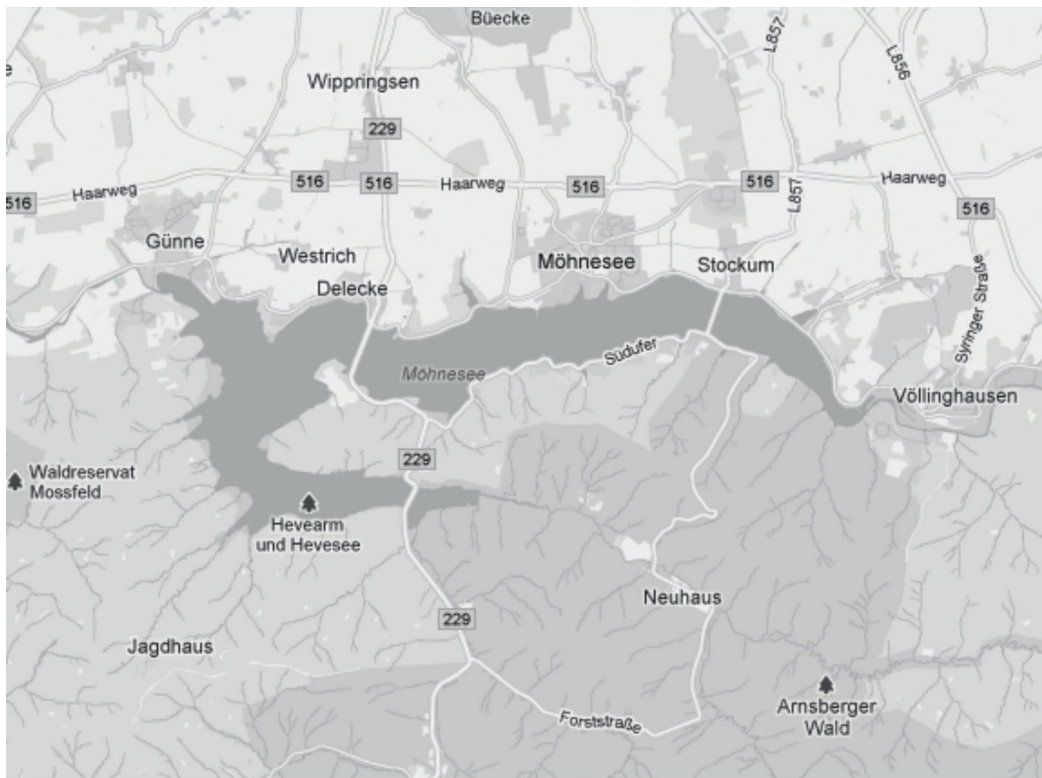
M 3: Freizeitkarte für den Möhnesee