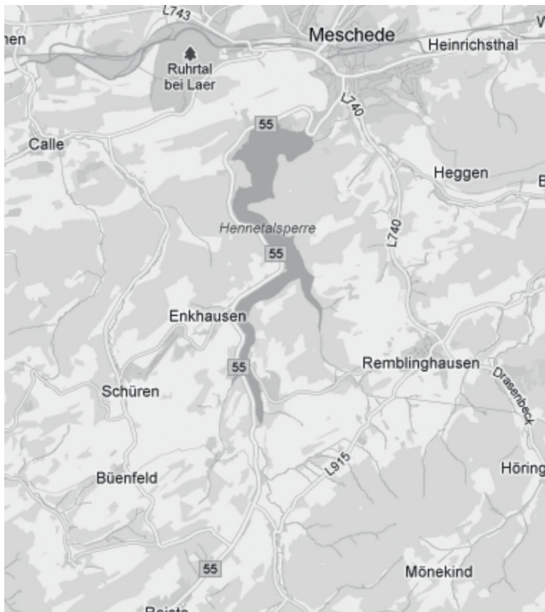
M 5: Freizeitkarte für den Henneesee